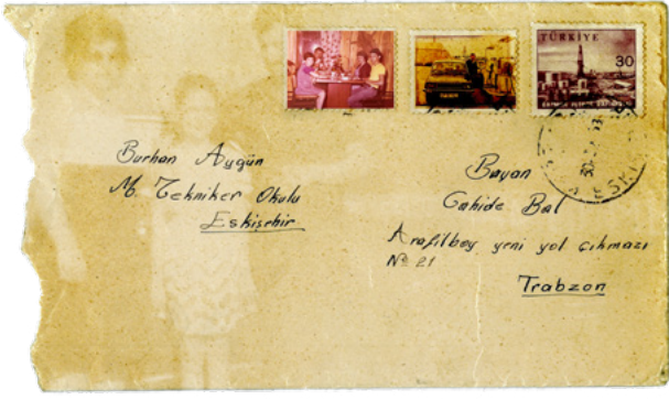
Görsel: "Otoetnografi" (2022, detay), Bengi Lostar Özdemir