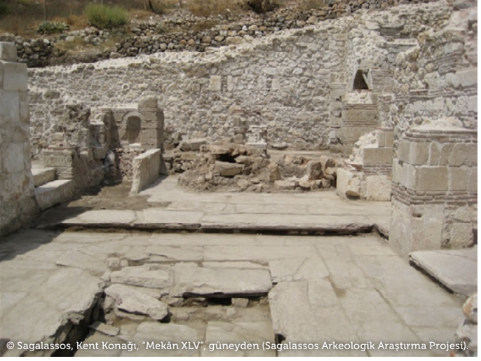
© Sagalassos, Kent Konağı, "Mekân XLV", güneyden (Sagalassos Arkeolojik Araştırma Projesi).

geliştirilmesine yardımcı olmaktadır. Hellenistik, Roma ve Geç Antik Dönem Sagalassos'luların ev seçimleri ile yaşam biçimleri Pisidia bölgesindeki komşularından ve Küçük Asya'nın geri kalanından çok da farklı değildir. Özel mimaride görülen mimari formlar, altyapı ve süsleme öğeleri başka yerlerde de geçerli olan genel modayı takip etmiştir.